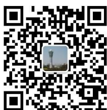
漯河气象微信订阅号